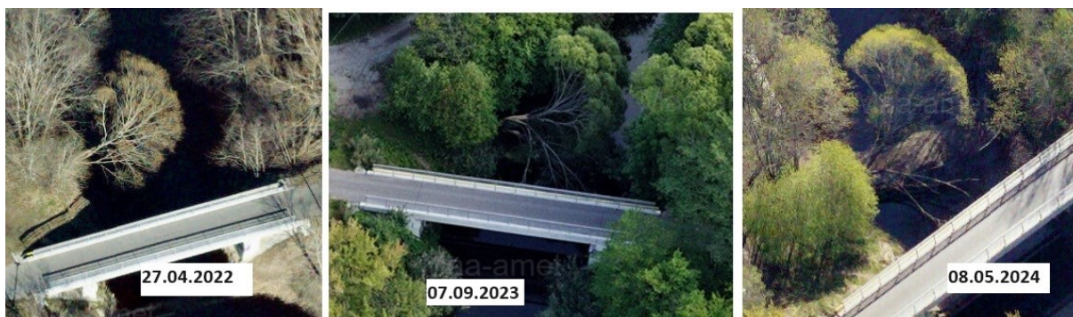
Foto 2. Maa-ameti ortofotod Kõrkja tee silla kõrval vette kukkunud puudest.

Antud kohas, Kõrkja tee silla juures, kuulub Pirita jõgi keskkonnaministri 15.06.2004 määruse nr 73 „Lõhe, jõeforelli, meriforelli ja harjuse kudemis ja elupaikade nimistu“ alade hulka, seetõttu on Pirita jõe veekaitsevööndis raied keelatud. Erandid on lubatud juhul, kui puistu ohustab inimeste tervist, vara või ühiskondlikult olulise taristu toimimist, ohutust. Keskkonnaamet selgitab, et veekogu kaldal kasvavad, vette kukkunud ja surnud puud on elu- ning varjepaigaks vee elustikule, lindudele, imetajatele ning putukatele.